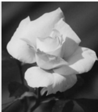
Le massif des senteurs : Sentir

Atelier : identifier et classer les senteurs Supports : coffret des senteurs (contenant une vingtaine d'essences différentes), parfums.