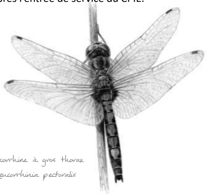
Leucorhina à gros thorax Leucorhina pectoralis

Le parking visiteurs est situé à environ 100 m après l'entrée de service du CPIE.