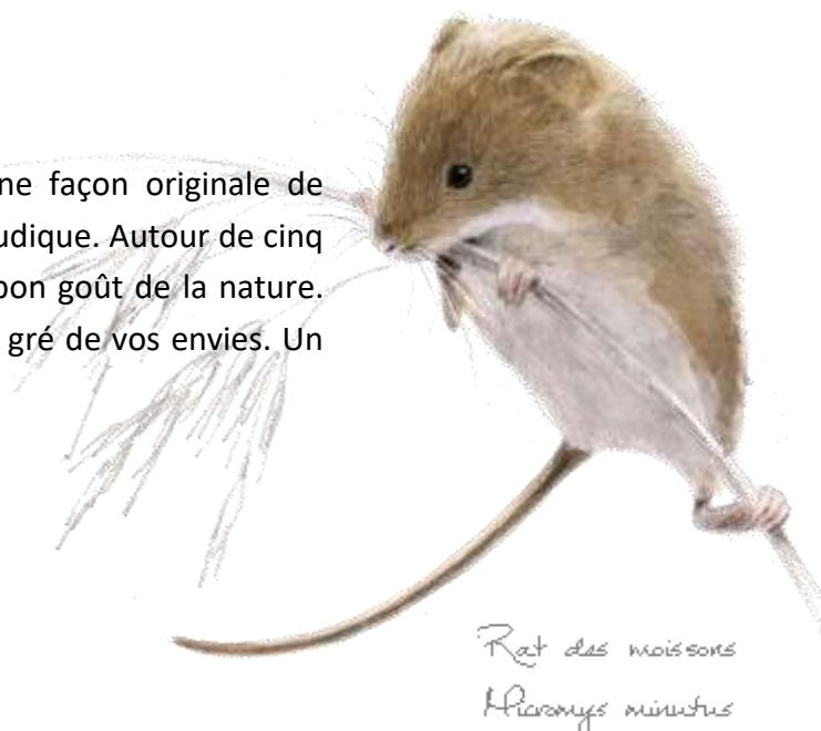
Rat des moissons Microtus minutus

Sentir, goûter, écouter au contact des plantes. Voilà une façon originale de renouer avec la nature et d'aiguiser vos sens de manière ludique. Autour de cinq massifs représentant les cinq sens, venez redécouvrir le bon goût de la nature. En visite libre, venez vous promener dans notre jardin au gré de vos envies. Un livret de visite vous sera fourni gratuitement à l'accueil.