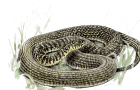
Couleuvre verte et jaune